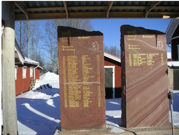
Ehrentafel für die Sieger des Bergpreises in Evertsberg bei km 48